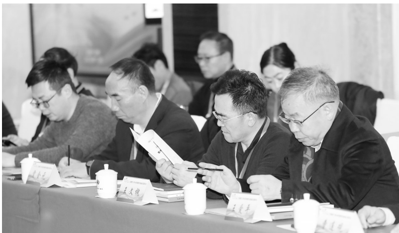
研讨会现场。

本报讯(掌上兰州·兰州晨报记者赵鑫远)12月16日,《甘肃教育》创刊40周年暨教育与媒体融合发展研讨会在兰州召开。