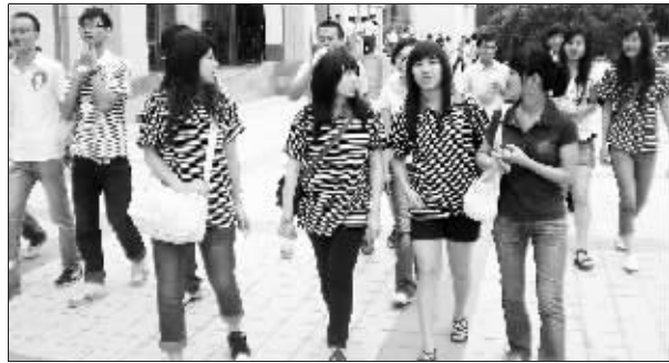
两岸大学生在兰大友好交谈。

2009年台湾大学生夏令营甘肃分营是全国台联主办的“龙脉相传、青春中华”千名台湾大学生夏令