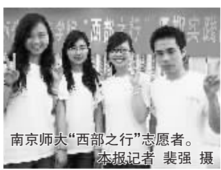
南京师大“西部之行”志愿者。

成志愿者队伍,来到我省地震灾区文县,进行了为期7天的暑期社会实践活动。他们走访了文县保子坝乡的部分贫困家庭、与文县一中的学生进行交流、宣传抗震救灾知识。并为文县干沟坪村陈俊辉苗圃希望小学的孩子们带去了南京师范大学学子们捐助的文具、书籍等爱心物品。志愿者蔡